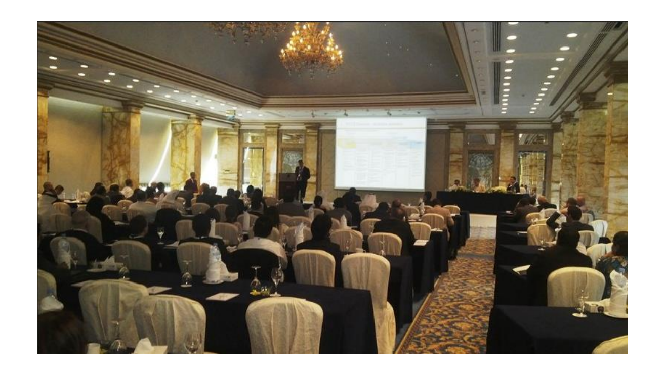
ASAR-AI Ruwayeh & Partners Hosts Leading Seminar on implications of Foreign Account Tax Compliance Act across Kuwaiti businesses